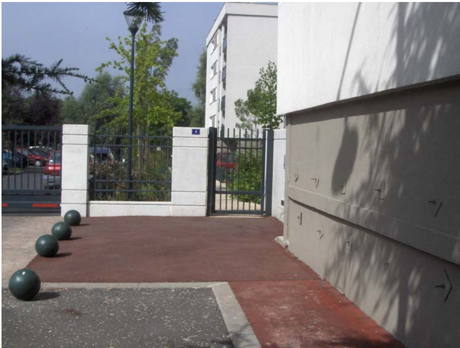
Résidence R4 - 4 rue du Petit Pont