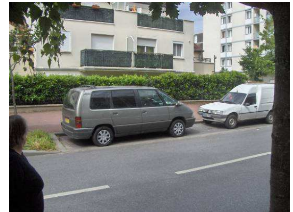
Rue du petit Pont