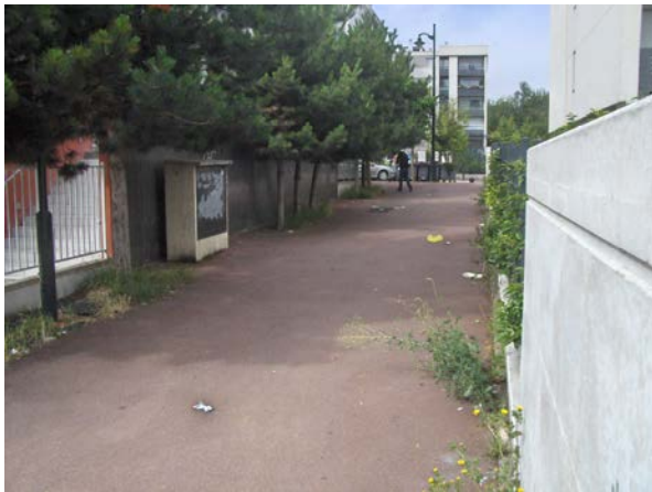
Cheminement Rue Papeterie – Rue du Petit Pont