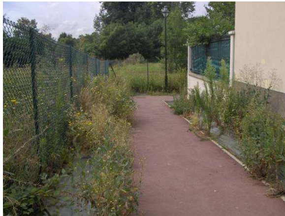
Cheminement derrière GS La Nacelle