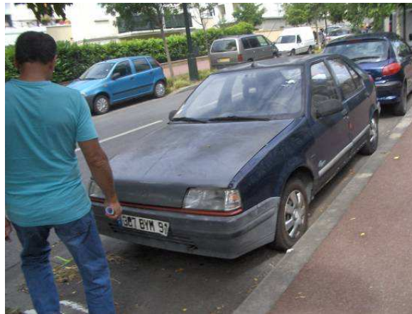
Rue du petit Pont