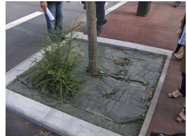
Fosses d'arbres – Rue Bernardin