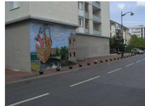
Sur chaussée – Rue du Petit Pont / Déficit de l'offre de stationnement?