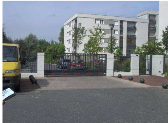
Au niveau accès des résidences/