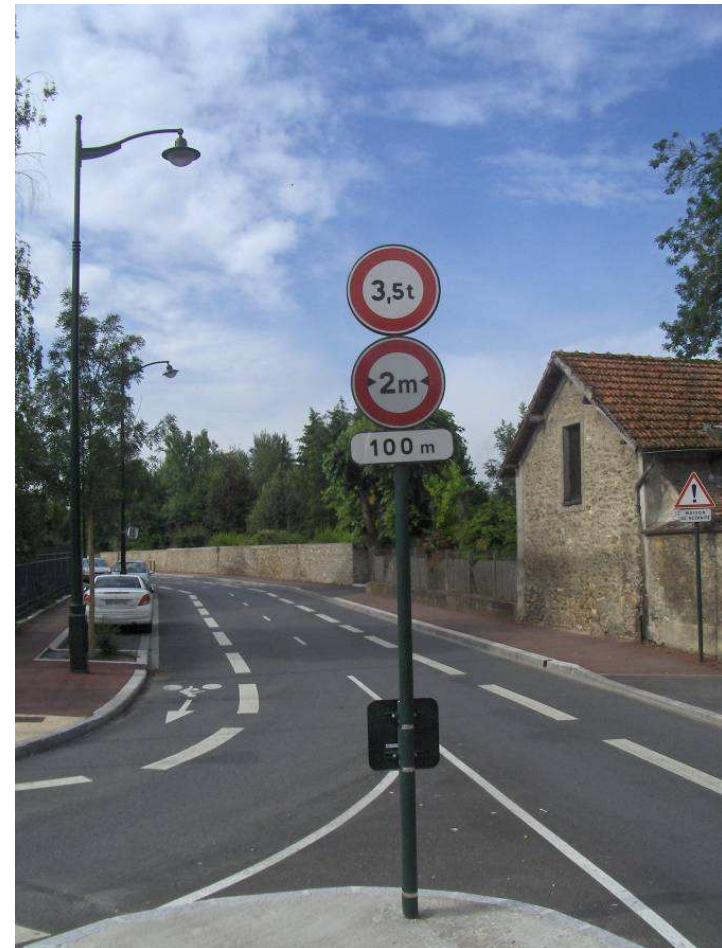
Rue Bernadin St Pierre/angle rue de la Papeterie