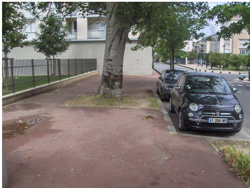
Trottoir dégradé lié à la présence de racines