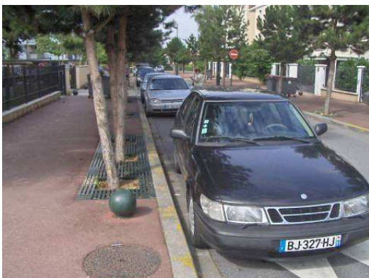
Sur chaussée – Rue Paul et Virginie / marquage au sol insuffisant/signalétique