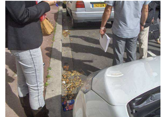
Caniveau Rue du petit Pont