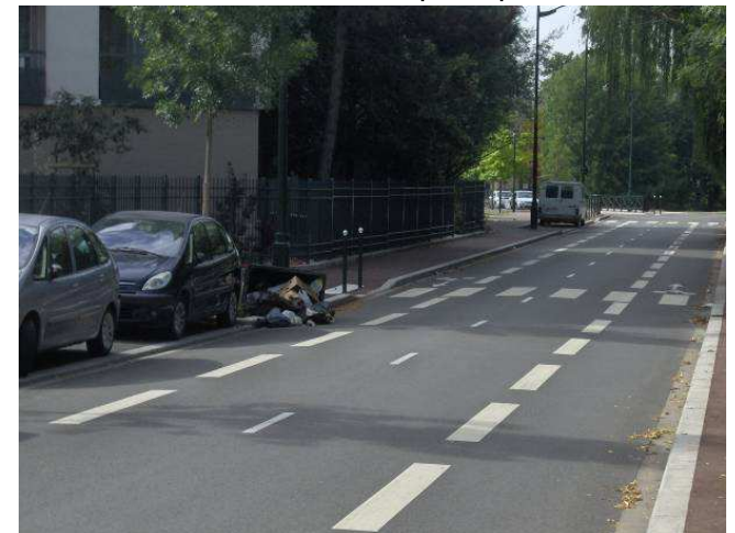
Containers tombés sur voie publique/rue Bernardin