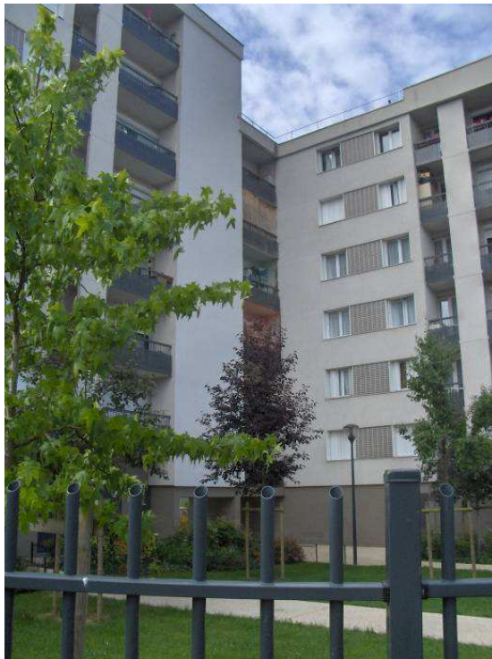
Résidence R4 - 2 rue du Petit Pont