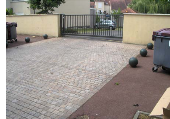
Au niveau accès des résidences/ Mobilier urbain enlevé (plots)