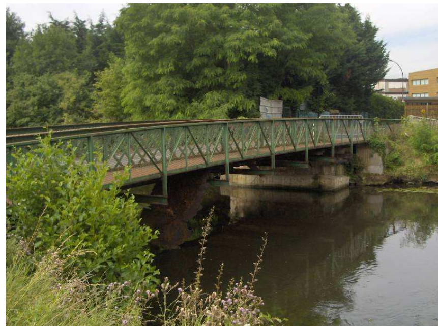
Pont sur l'Essonne