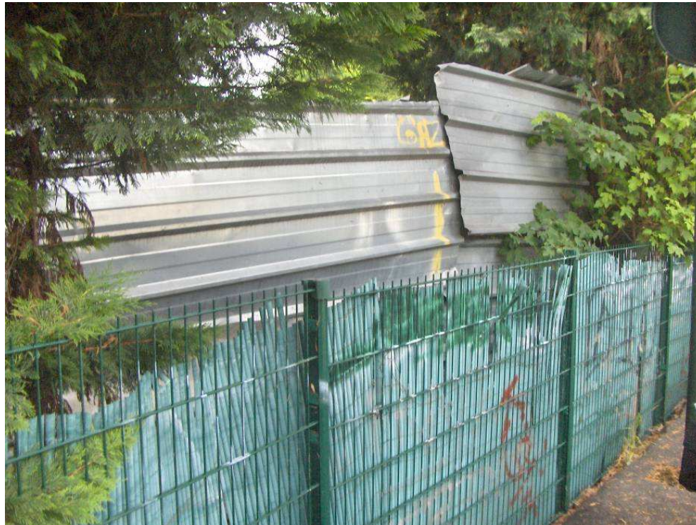
Rue de la Nacelle – niveau pont sur l'Essonne