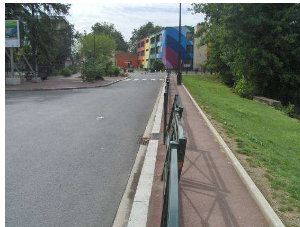
Barrière dégradée, à réparer/remplacer