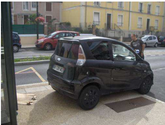
Sur trottoir Rue de la Papeterie (niveau arrêt de bus)