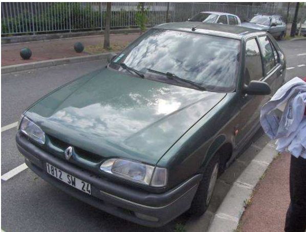
Rue du petit Pont