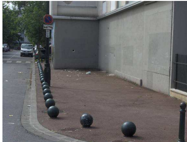
Trottoir Rue du petit Pont