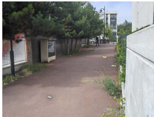
Sur sente piétonne (niveau arrêt de bus) / Mobilier urbain enlevé (plots)