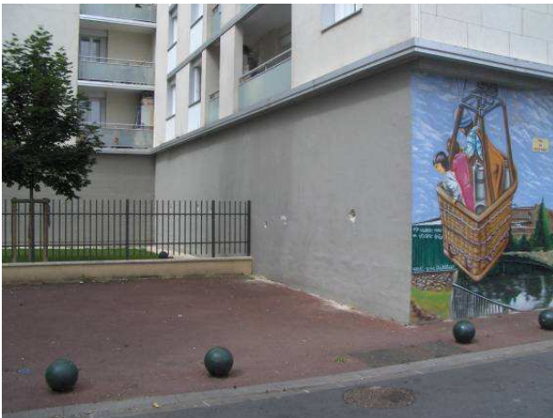
Rue du Petit Pont / plots enlevés à sceller