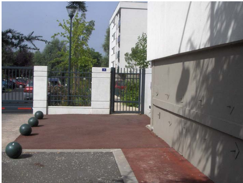
Résidence R4 - 4 rue du Petit Pont