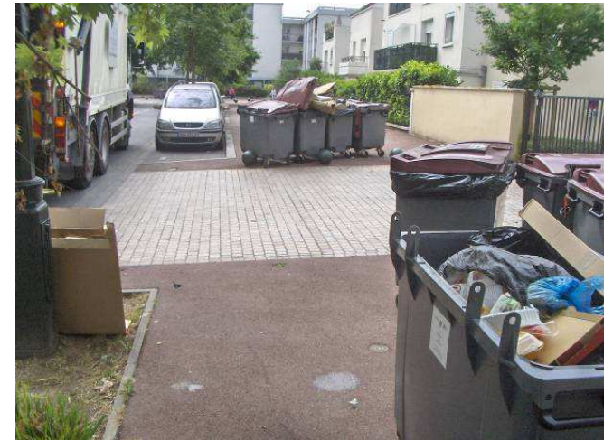
Containers stockés sur voie publique/rue Petit Pont