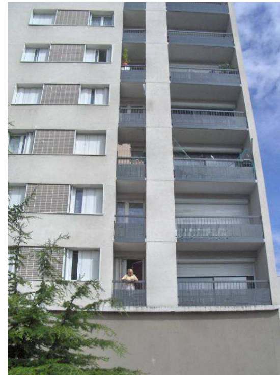
Résidence R4 - 4 rue du Petit Pont