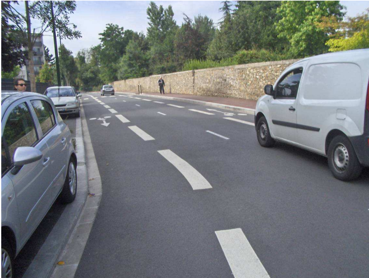
Rue Bernardin St Pierre