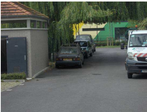
Résidence au 6-8-10 rue du petit pont