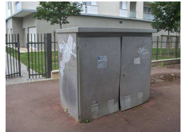
Poste GAZ rue Papeterie /à réparer et repeindre à minima en vue d'améliorer le visuel